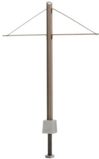
Straßenbahn H-Profil Mittelmast 5 Stück 70804 | 1:87