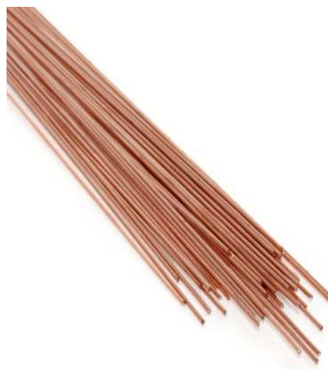
Einfach-Fahrdraht 0,7 x 250 mm, 40 Stück 70802 | 1:87