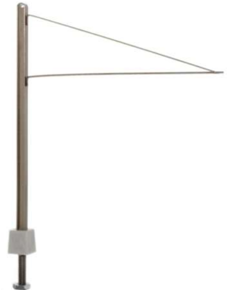
Straßenbahn H-Profil Mast mit Doppelausleger 5 Stück 70805 | 1:87