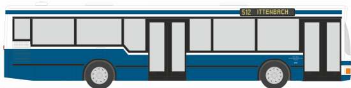
MAN NL 202-2 „RSVG, Troisdorf“ 75000 | 1:87 | D