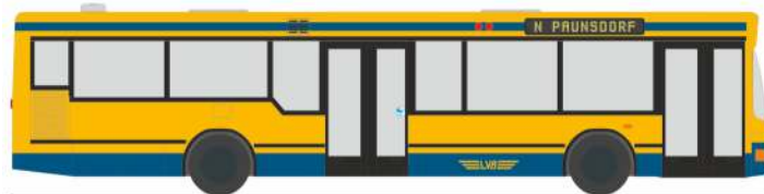
MAN NL 202-2 „Leipziger Verkehrsbetriebe“ 75001 | 1:87 | D