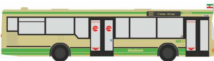
MAN NL 202-2 „HCR, Herne“ 75004 | 1:87 | D