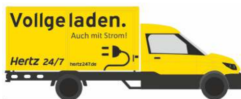
STREETSCOOTER Work L „Hertz Autovermietung“ 33003 | 1:87 | D