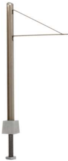
Straßenbahn H-Profil Streckenmast 5 Stück 70803 | 1:87