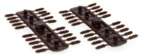
Rillen-Isolator 1,9 x 6,0 mm, 40 Stück 70801 | 1:87