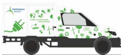
STREETSCOOTER Work „Städteregion Aachen“ 33000 | 1:87 | D