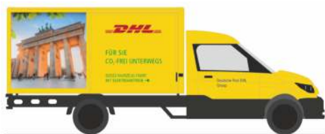
STREETSCOOTER Work L „Deutsche Post / DHL - Design Berlin“ 33002 | 1:87 | D